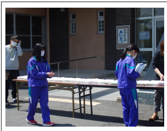
《4月30日3年生課題提出及び課題配布》 ズムが乱れている人は必ず立て直していきましょう。