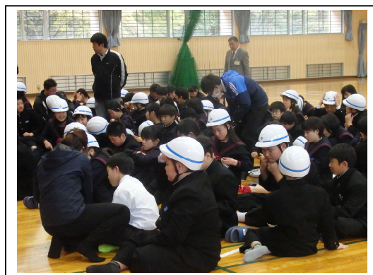
1年生交通安全教室 4/17 体育館にて

中学校に入学し、自転車に乗る機会がふえます。年々交通量が増える傾向があり、通学中に事故にあわないように自転車の安全な乗り方について警察署の方に来ていただいて話を聞く機会を持ちました。命を守るためには「ヘルメットの着用」が大切であるなど具体的に教えていただきました。また、生徒会役員の皆さんから自作のビデオを使って交通ルールなどを確認していただきました。