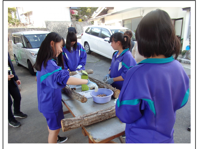
シイタケの菌を植え付ける作業 伊那市にて

人としての生き方、人権についてあらためて考えることができました。16時30分からは、東京ディズニーランドにて乗り物に、買い物に楽しいひとときを過ごしました。3日目はホテルを出て、国会議事堂の見学をしました。日本の政治の中心である国会議事堂は重厚な建物で、衆議院の会議場も見学でき、貴重な経験ができました。その後、班ごとに国会議事堂を出発し、上野公園、浅草寺、スカイツリー、東京タワーなど、各班の計画にそって巡り、東京駅に到着しました。また、移動中のバスの中では、ゲームやクイズ、カラオケ大会と学級の和を高める催しが行われました。