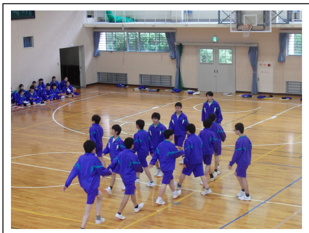
集団行動発表会 歩きながら交差 体育館にて