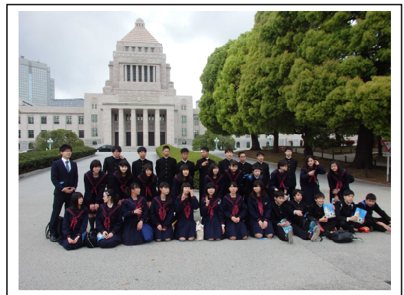
日本の政治の中心 国会議事堂にて

今までの中学生活でしっかりとした生活ができていたことが、そのまま、修学旅行でも出せたと思います。学校のリーダーとして、たのもしさを感じさせる3年生の姿がありました。