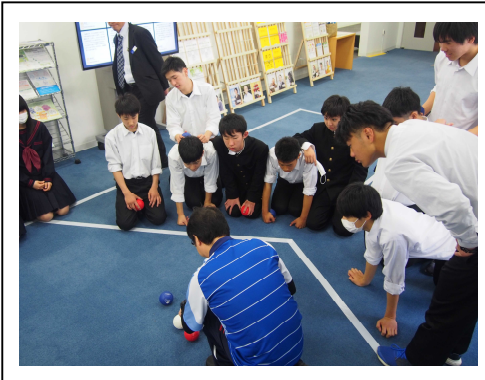
ボッチャの体験 人権プラザにて