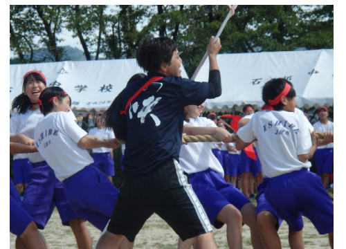
学年別種目（2年綱引き）