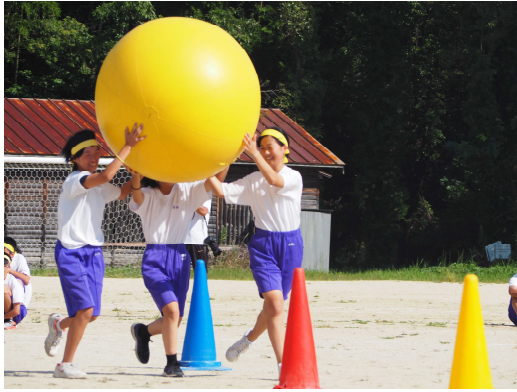
絶対落とすな元気玉（大玉運び）