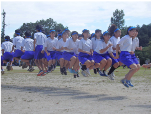
学年別種目（3年大縄跳び）