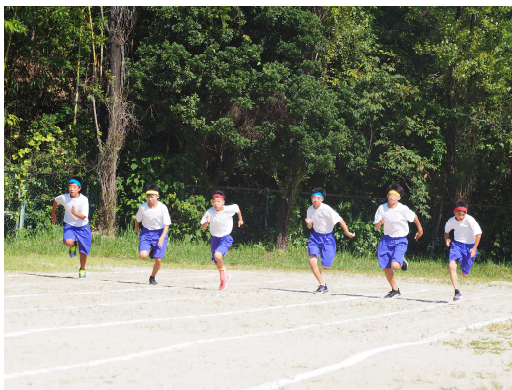
短距離走（男子 100m女子 70m）